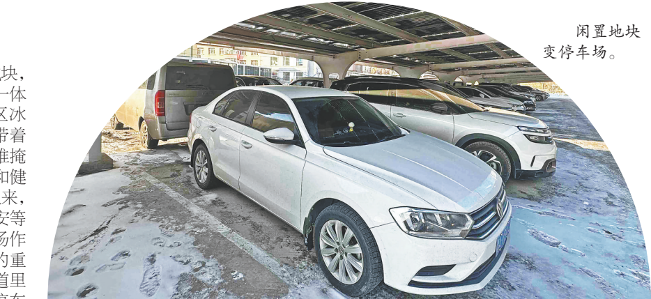
闲置地块 变停车场。

面对专业复合型人才短缺、传统管理模式滞后、产业升级遇阻的三重发展困境,太平供热公司党委以党建为笔破题解题,历经三次淬炼铸就“精·党建”品牌内核。在人才培养上,构建“结构优化+双培养”人才战略,深化“党员与骨干双向培养”模式,通过技能比武、“传帮带”等举措激活人才成长动能;在管理革新上,修订管理制度、