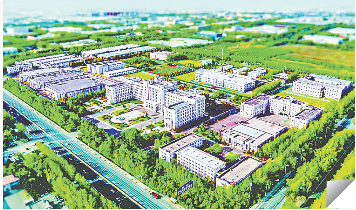
哈兽研新区鸟瞰图。

求，以高水平科技自立自强，助力龙江产业向新而行、向高而攀。以科技创新引领产业全面升级，冲击胶粘剂国际领先地位，构建生物制造底层技术支撑。深化“人工智能+”应用，推动智能制造、生物育种、新材料研发等产业智能化升级，培育数字经济新增长点。实施产业链赋能，推动中国科学院、高校等创新资源下沉县域、对接企业。布局未来产业，在生物制造、大健康、能源等领域建立重点项目集群，打造关键技术策源地。扩大开放协同，深化与国家战略科技力量及龙头企业合作，助力龙江高质量振兴发展。