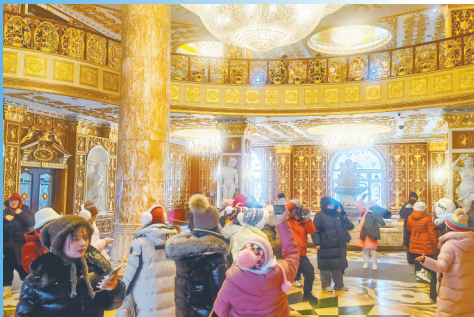
市民和游客参观哈药六版画博物馆。