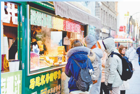
市民和游客在老街品尝美食。