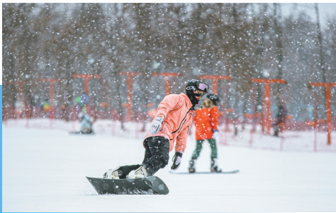
游客在天恒山冰雪运动大世界滑雪。

2025-2026年冰雪季,道外区立足优质冰雪资源与深厚文化底蕴,精心打造都市冰雪、冰上竞技、非遗民俗、百年美味、艺术漫游五大冰雪旅游线路,推动文旅产业提质增效。从松花江畔的速度激情到中华巴洛克历史文化街区的复古浪漫,再到文化场馆的沉浸式体验,道外区以多元场景、优质服务和丰富业态,推动“冰天雪地”向“金山银山”高效转化,为市民和游客呈现出底蕴与活力兼具的冬日魅力图景。