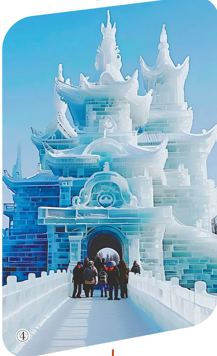
①②③④⑤冰雪大世界里的冰雕作品。