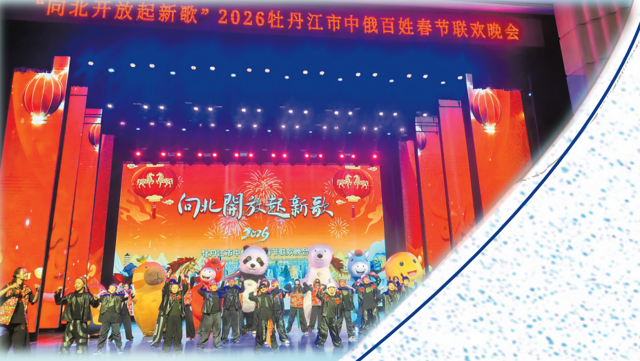
2026牡丹江市中俄“百姓春晚”。

鼓励引导文化类企业“走出去”。推荐牡丹江市9个系列展品参展哈洽会、深圳文博会及“龙江好物”(深圳)展销活动,省级非遗唐满格旗袍等参展企业产品备受好评,2个项目达成意向签约。在第十七届龙江文创会设立牡丹江展区,组织20余家企业600余件展品参展。推荐城市文创伴手礼《东北大花虎》参展黑龙江-香港投资合作交流活动,国家级非遗渤海鞋刺绣产品在法中企业经贸合作交流会上广受关注。