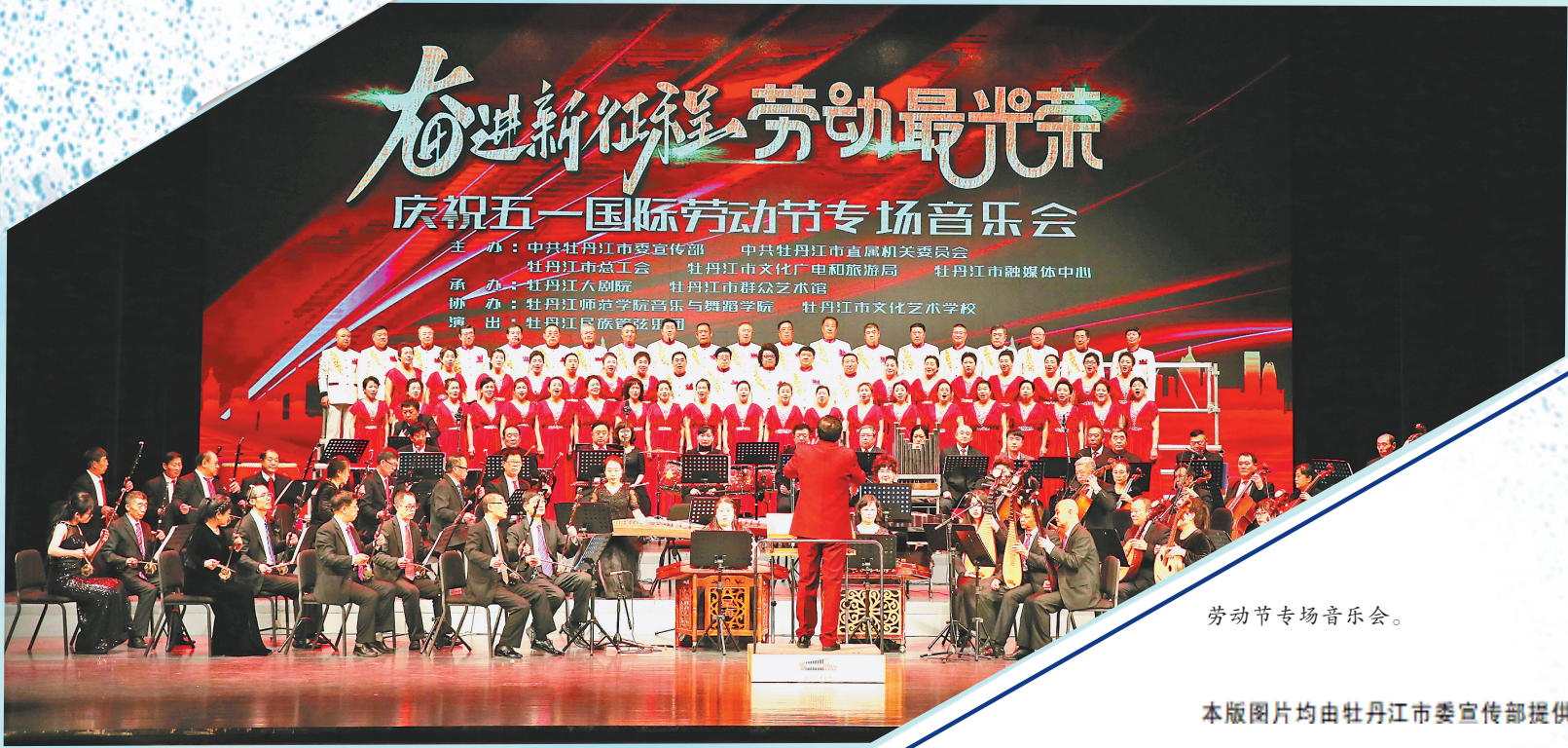
劳动节专场音乐会。

展望未来,牡丹江市文化战线将继续深耕冰雪、渤海、红色、民俗等特色文化资源,持续推动文艺精品创作,创新开展文化惠民活动,加速文化产业集聚,深化对外文化交流。通过坚定不移地走好文化惠民、品牌打造、深入基层、网上网下协同的群众路线,全面提升文化供给质量,让更多群众享有更高质量的精神文化生活,切实增强人民群众文化获得感,以文化之笔描绘高质量发展新画卷,为龙江全面振兴贡献力量。