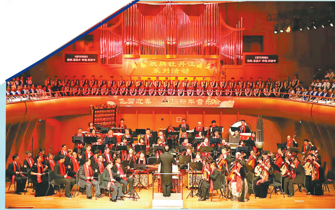
“欢腾牡丹江”迎新音乐会。

这种跨界融合的创新实践,不仅体现在文旅消费领域,也贯穿于群众文化活动的全方位传播。牡丹江市坚持传统媒体与新兴媒体,“大屏”与“小屏”融合发力,营造群众文化活动浓厚氛围。充分利用牡丹江大剧院公众号、市级融媒体中心等数字平台开设专题专栏,对群众文化活动进行集中展示、动态展示、重点展示,进一步提高群众文化活动的影响力、覆盖面和参与度,树立了群众文化活动基层“热”、活动“亮”、作品“火”的品牌形象。网上网下共绘盛景,文化赋能消费、创新引领生活的热度持续攀升。