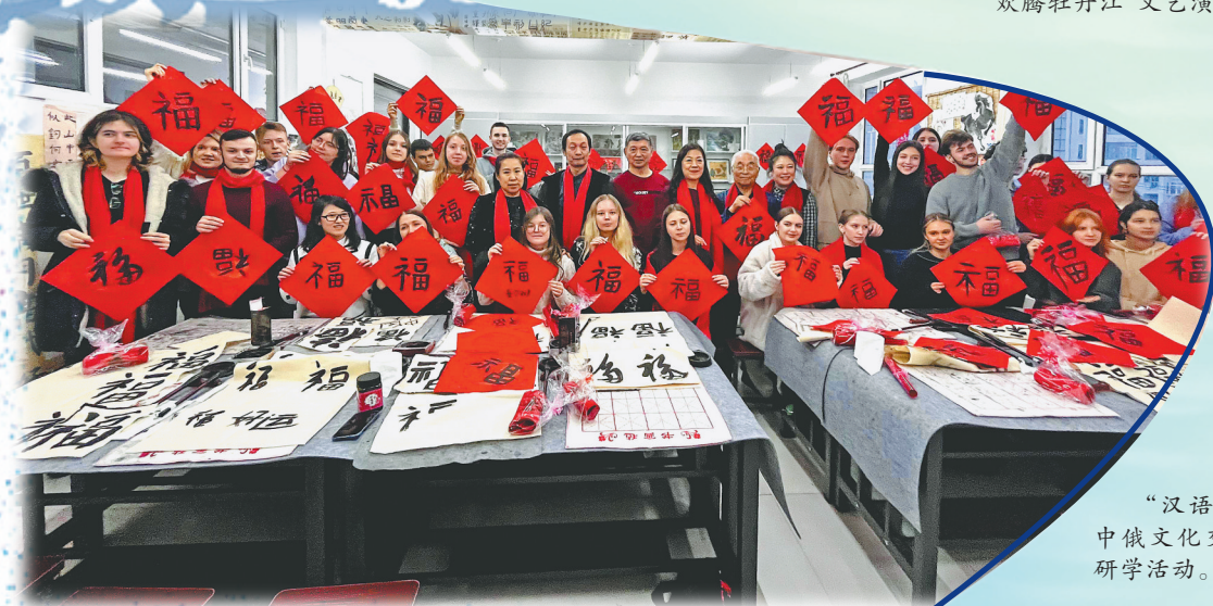
“汉语桥”中俄文化交流研学活动。

这些深入基层的举措,不仅为精品创作积累了鲜活素材,培育了本土人才,更持续推动文艺服务走深走实,让城市形象在一部部凝聚时代精神与人民智慧的精品力作中熠熠生辉。