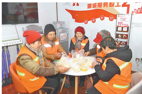
清晨,环卫工人吃上热乎乎的爱心早餐。