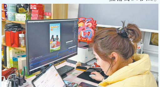
工作人员实时查看直播数据。

的优质鹅种,经过多道工序慢烤而成,表皮酥脆、肉质鲜嫩,凉吃不腻、热吃更香,很多老呼兰人都是吃着我们的烤鹅长大的。”说着,他轻轻撕下一块鸡肉,直播间瞬间被“看着就香”“想买来当下酒菜”的评论刷屏。