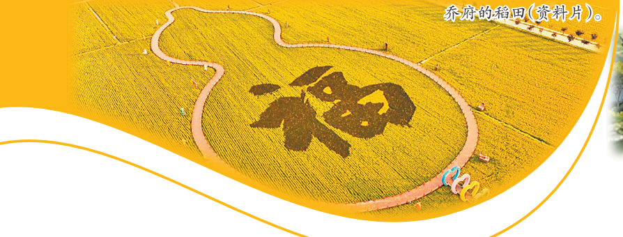
乔府的稻田(资料片)。