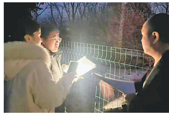
文物工作者在“四普”实地验收。

这次普查的意义，远不止于摸清文物“家底”。为了详实掌握普查工作总体情况，确保普查成果真实准确、质量可控，验收组详细听取了全省95个县区普查领导小组组长介绍普查情况，各县区普查领导小组组长直接参与验收工作。这一机制，让文物保护从“部门工作”上升为“地方党委政府工程”，促进各地文物保护