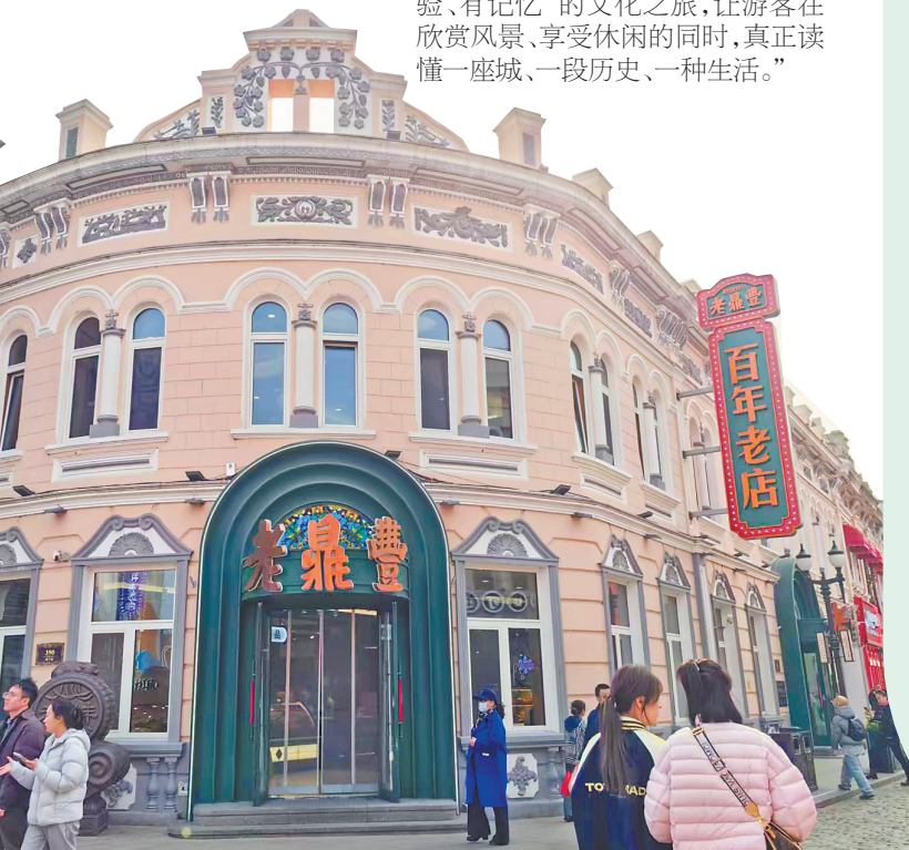
百年老字号老鼎丰总店。

记者深入探访发现，蕴藏于建筑稀缺性、人间烟火气与季节性IP联动中的“三维共振”效应，正重塑着中华巴洛克历史文化街区的核心竞争力。