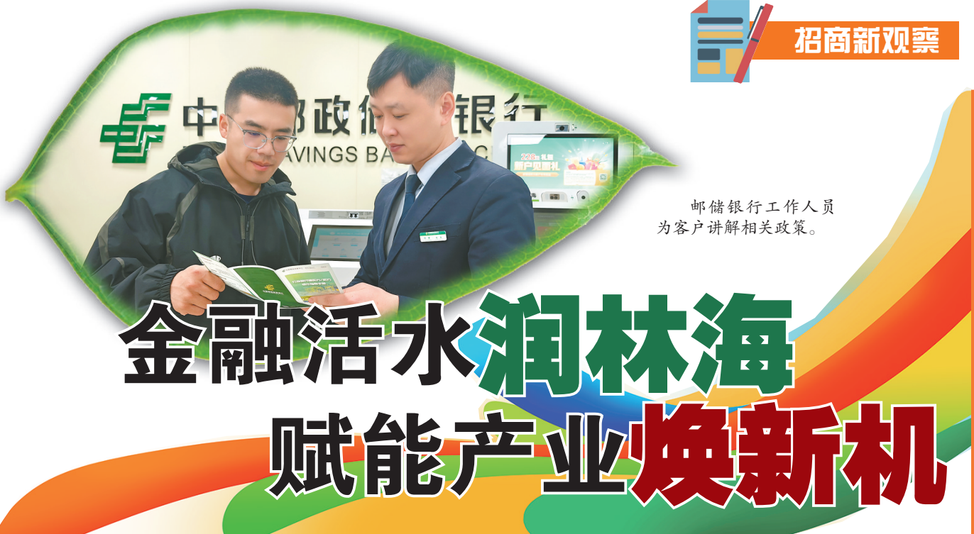
邮储银行工作人员为客户讲解相关政策。

从信息咨询到服务指引,“洽洽”化身参会者的专属智慧助手,用科技感拉满的贴心服务,让海内外参展商、采购商和观众逛展更轻松。