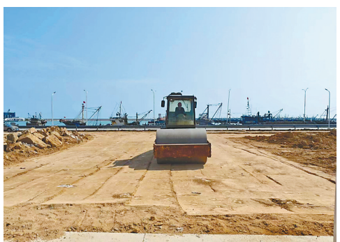
项目建设现场。

征程万里风正劲,重任千钧再出发。港航公司将以首季“开门红”为新起点,紧盯全年目标任务,倒排工期、挂图作战,持续深化项目精细化管理,加大技术创新力度,抓实抓细安全生产与质量管控,全力保障各在建项目按期高质量交付,以实干实绩为航运集团全年高质量发展贡献港航力量。