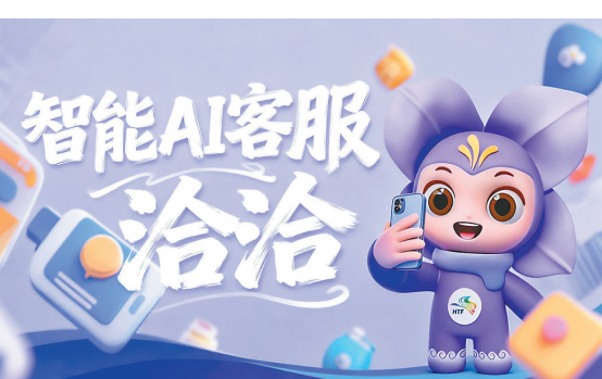
智能AI客服“洽洽”。

本报讯(记者曲静)距离第十届中国博览会和第三十五届哈洽会开幕还有一个多月,展会数字化服务迎来萌趣新成员—卡通形象智能AI客服“洽洽”正式官宣上线,这位集软萌颜值与硬核实力于一身的萌娃小助手,将驻守展会官方平台,为全球宾客解锁“零障碍”逛展新体验。