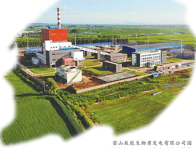
密山辰能生物质发电有限公司园区(资料片)。