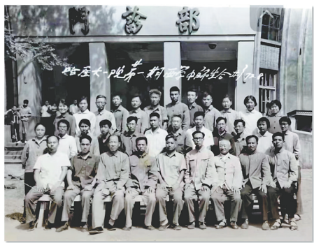
哈医大一院第一期“西学中”学习班师生合影(摄于1972年8月)。