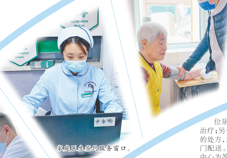
家庭医生签约服务窗口。