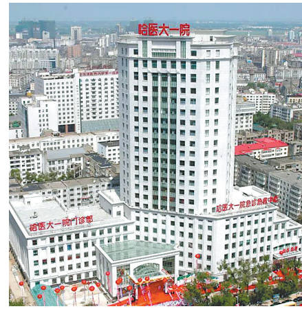
哈医大一院门诊保健大楼(摄于2007年6月)。