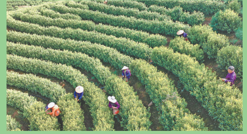
4月18日,在湖南省衡山县开云镇,当地村民在茶场采摘春茶(无人机照片)。