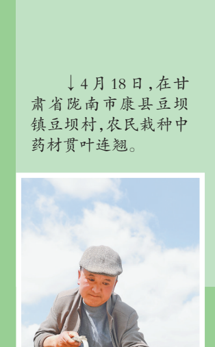
↓4月18日,在甘肃省陇南市康县豆坝镇豆坝村,农民栽种中药材贯叶连翘。