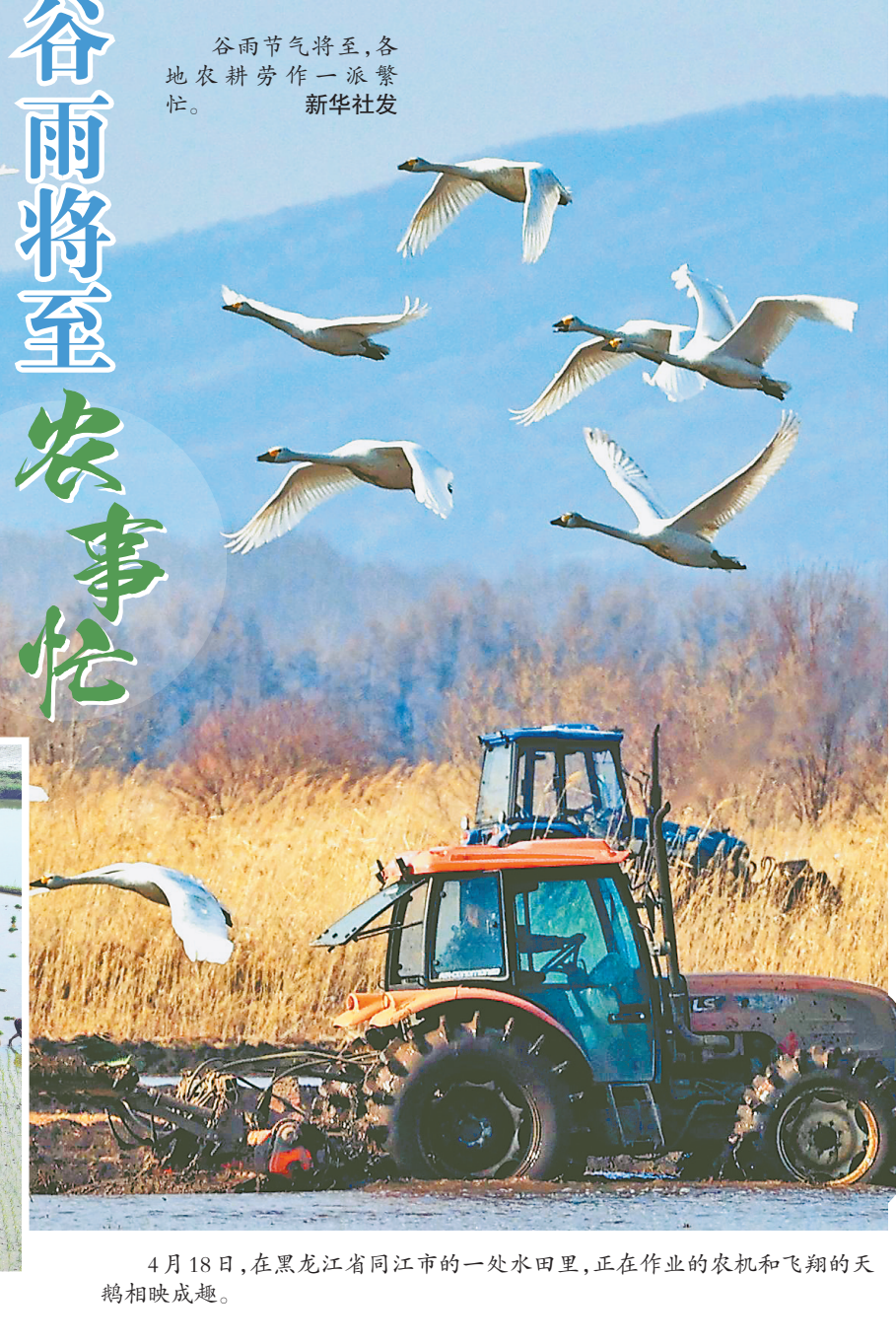
谷雨节气将至,各地农耕劳作一派繁忙。