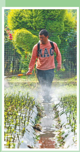
↑4月19日,浙江省金华市金东区岭下镇农田里,村民在对果树幼苗进行田间管理工作。