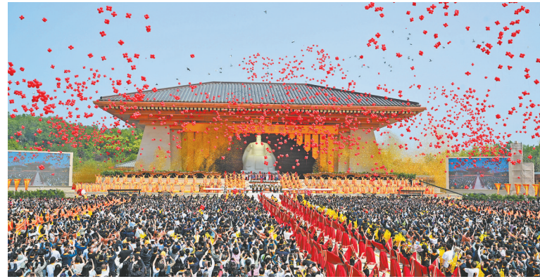
这是4月19日拍摄的丙午年黄帝故里拜祖大典现场。

新华社郑州4月19日电(记者王前慧)三月三,拜轩辕。4月19日,丙午年黄帝故里拜祖大典在河南省郑州市新郑市举行。大典的主题为“同根同祖同源,和平和睦和谐”。