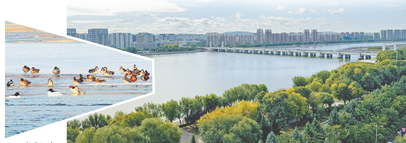
牡丹江畔“百鸟欢鸣”。