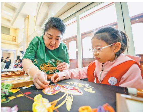
现场教学。

本报讯(记者张春雷)日前,2026年哈尔滨市“博物馆季”系列活动在哈尔滨市博物馆7号楼阳光大厅启动。