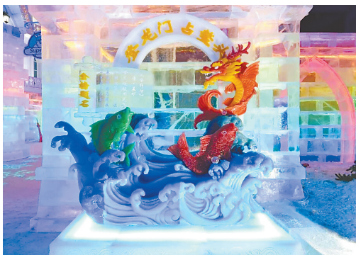
“鱼跃龙门”主题冰雕作品。

本报讯(记者刘艳)近日,哈尔滨冰雪大世界梦幻冰雪馆冰雪景观再度上新。全新主题冰雕作品“鱼跃龙门”将“跃龙门占鳌头”的期许与孟郊《登科后》的豪情,凝于冰雪之中,为莘莘学子送上跨越古今的祝福。