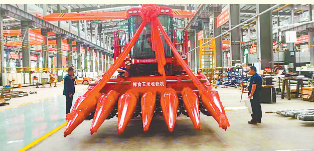
黑龙江省农业机械工程科学研究院专利成果“铧接转向式鲜食玉米联合收获机”产业化案例入选黑龙江省专利产业化十大案例。

截至2025年年底，黑龙江省发明专利有效量为51837件，是“十三五”末的1.9倍。企业有效发明专利达19255件，同比增长9.5%，专利结构持续优化，企业有效发明专利拥有量占比由“十三五”末的29%提升至37%。全省商标有效注册量达580798件，同比增长8%，较“十三五”末增长81%，知识产权储备稳步增长。黑龙江省《以“四个体系”为抓手，推动专利与标准融合发展》案例，成功入选全国知识产权强国建设第二批典型案例，龙江经验走向全国。