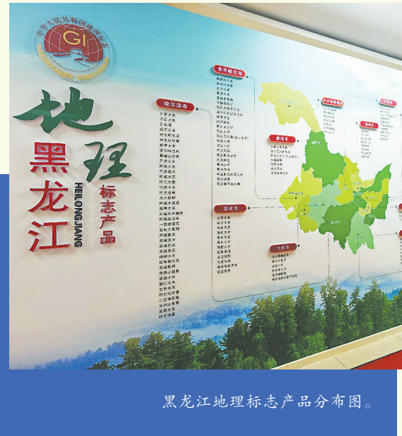
黑龙江地理标志产品分布图。

高标准承办欧亚专利制度巡回宣讲会，为我省创新主体学习和运用国际专利规则，更好地“走出去”参与国际竞争提供了宝贵的学习交流机会。相关做法在2025年全国知识产权国际合作工作会议上交流推广。建立中俄知识产权合作机制，深化专利审查、知识产权保护等务实合作，为构筑向北开放新高地提供知识产权支撑。