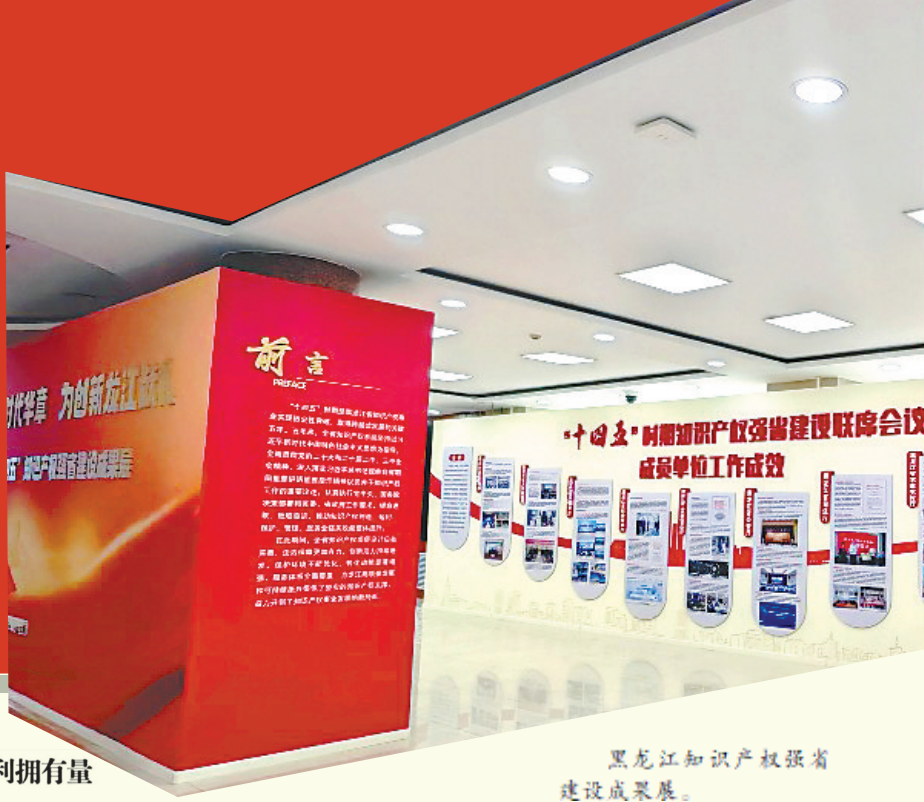
黑龙江知识产权强省建设成果展。

4月26日将迎来第26个“世界知识产权日”。回望“十四五”，在国家知识产权局、省委省政府的科学领导下，龙江大地以创新为帆、以知识产权为桨，深入实施知识产权战略，扎实推进知识产权强省建设，以改革创新破局开路，主动融入经济社会发展大局。五年砥砺前行，全省知识产权综合实力显著提升，知识产权事业取得长足进步，为龙江全面振兴全方位振兴注入了源源不断的创新动能与强劲活力。