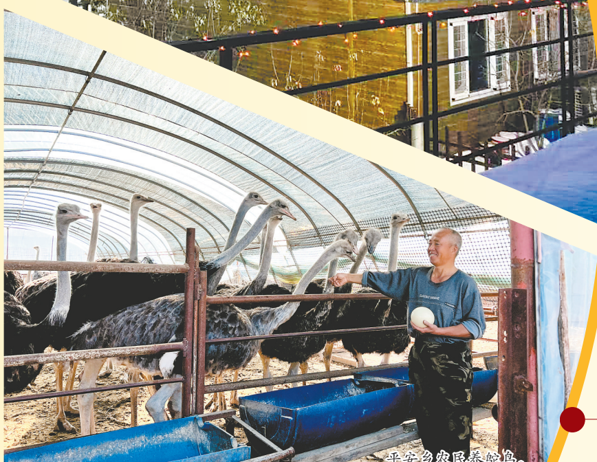
平安乡农民养鸵鸟。

习近平总书记强调，东北发展，无论新困境之困，还是求振兴之道，都要从思想、思路层面破题。近年来，佳木斯市郊区认真落实党中央决策部署和省委、市委要求，将干部能力作风建设作为推动高质量转型发展的先导性工程来抓，各级干部实干担当、勇毅前行，以能力作风之“变”聚发展之力、破攻坚之难、惠民生之利。