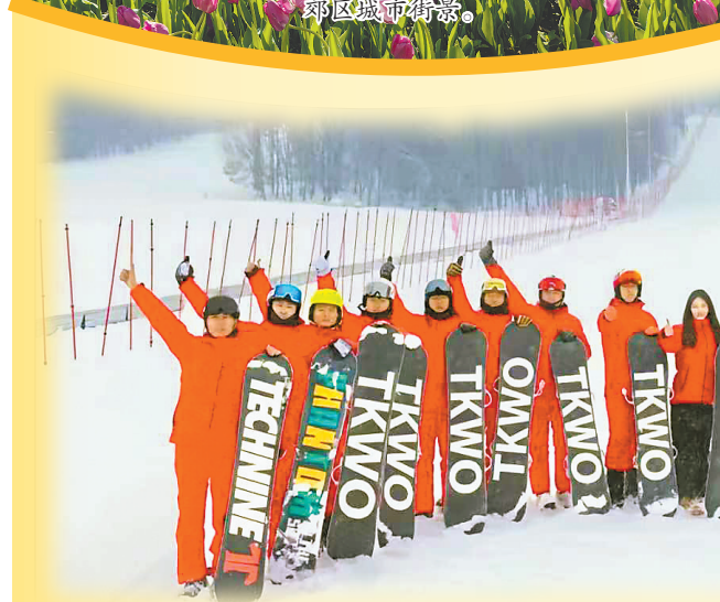
松花江教棋湾滑雪场。