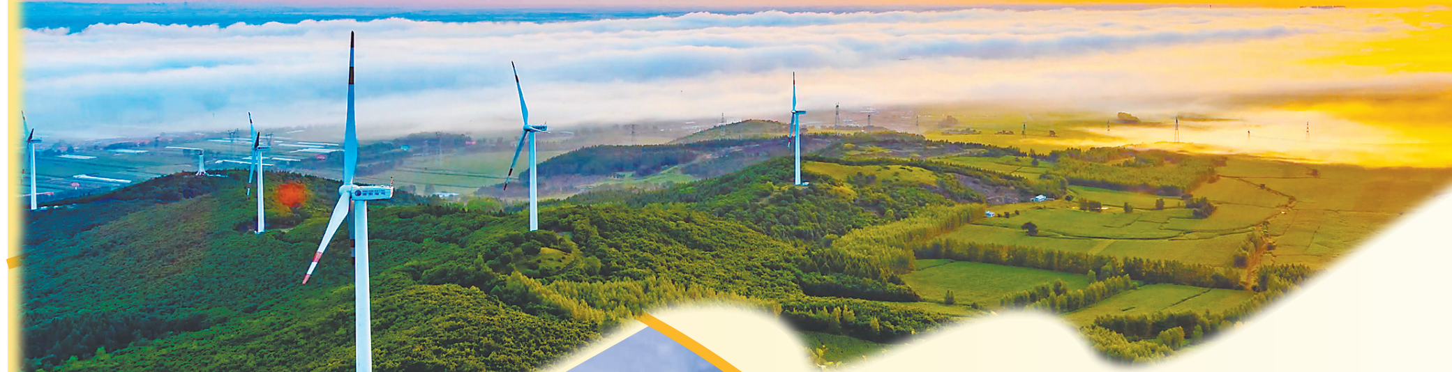
郊区四丰镇滨湖山庄。