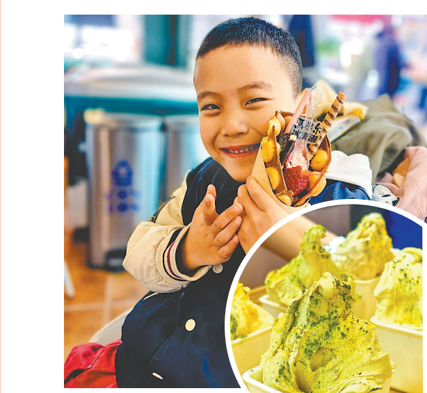
↑开心品尝莓满华夫杯冰淇淋。↑一果旋风杯。

本报讯(记者刘艳)近日,“好原料·当日做·好工艺·口感鲜”2026马迭尔冰淇淋春日焕新品鉴活动在马迭尔新一百店举行。活动现场,马迭尔现制冰淇淋首批三款产品正式开售。