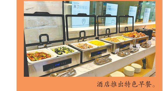
酒店推出特色早餐。

4月13日10时,哈尔滨市200万元餐饮住宿消费券正式上线发放,同步拉开了全市餐饮住宿行业促消费活动的序幕。此次消费券发放活动由哈尔滨市商务局牵头,联合美团平台共同开展,政府专项资金与平台配套资金双向发力,覆盖全市数千家餐饮、住宿商户,以真金白银的让利,点燃市民消费热情。