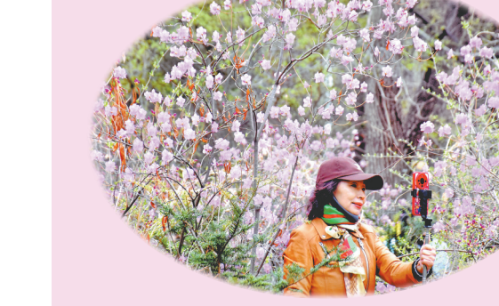
↑拍张美照。←记录瞬间。→林间散步。

近日,黑龙江省森林植物园春意盎然。树林深处,黄色的连翘花、红色的杜鹃花竞相绽放,景色怡人。许多市民和游客来到这里赏花游玩,感受春天的气息。有的在林间穿行,呼吸着新鲜空气;有的在一边观赏风景,一边拍摄精彩瞬间;有的坐在大树下野餐、聊天。孩子们骑着自行车或踩着滑板车,互相追逐着,欢笑声在树林中回荡。