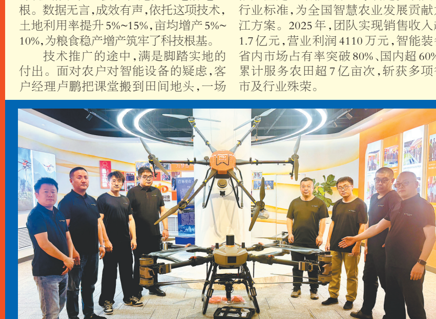
黑龙江惠达科技政企事业部东北一区团队。

不止于服务本土,团队更以实际行动担当,全程参与农业农村部门推广鉴定及推广,主导制定多项国家行业标准,为全国智慧农业发展贡献龙江方案。2025年,团队实现销售收入1.7亿元,营业利润4110万元,智能装备国内市场占有率突破80%,国内超60%,累计服务农田超7亿亩,斩获多项省市及行业殊荣。