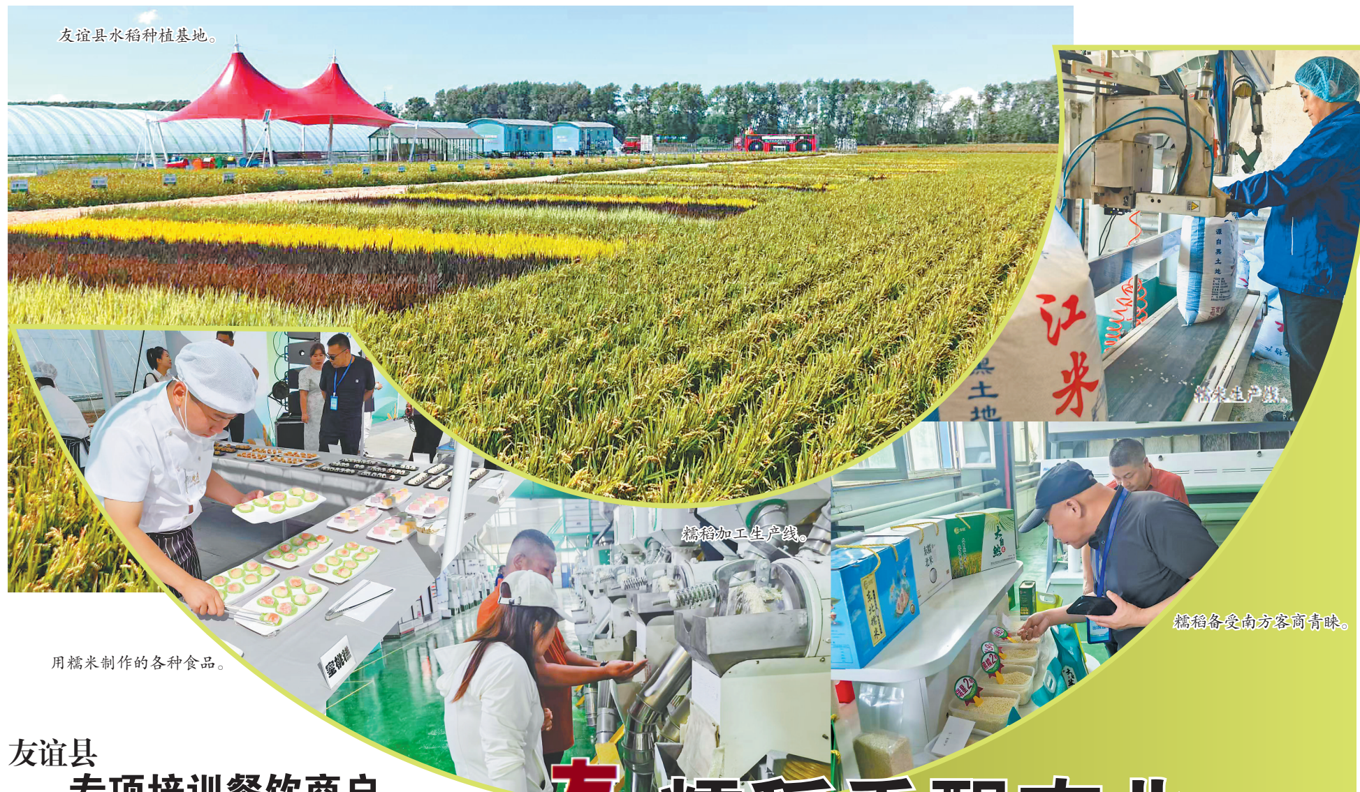
友谊县水稻种植基地。