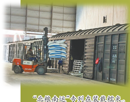
“北粮南运”专列在装载糯米。