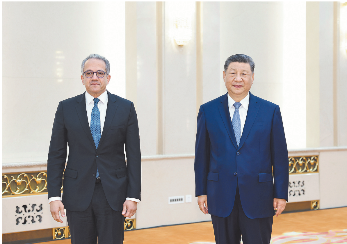
五月十二日下午，国家主席习近平在北京人民大会堂会见联合国教科文组织总干事阿纳尼。

新华社北京5月12日电(记者温馨)5月12日下午，国家主席习近平在北京人民大会堂会见联合国教科文组织总干事阿纳尼。 习近平指出，联合国教科文组织为增进各国人民相互了解信任、推动不同文明交流互鉴作出了重要贡献，也为改革完善全球教育、科学、文化治理发挥了积极作用。中方积极支持联合国教科文组织工作，双方共同为维护和促进世界和平、促进全球发展做了很多事情。中方愿同联合国教科文组织深化战略合作，更好造福世界各国人民。 习近平强调，当前，和平、发展、合