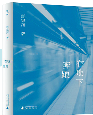
《在地下奔跑》/彭家河/ 广西师范大学出版社/ 2025年11月

读书写作，是文人学者的心之所向。往后岁月，我将初心不改，与书为伴，以笔为耕，在阅读与书写中沉淀自我、丰盈内心。当读书成为自己生命的一部分，你就会觉得读书如纯真的爱情一样美好。