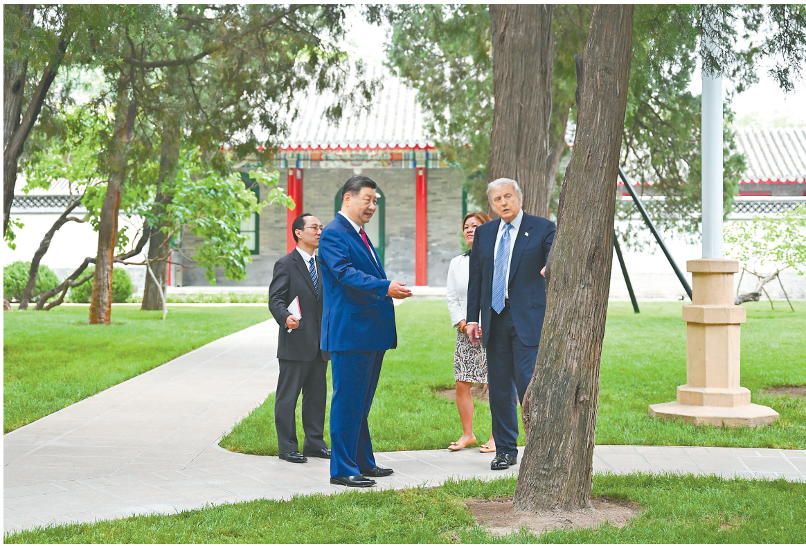
5月15日上午，国家主席习近平在中南海同美国总统特朗普举行小范围会晤。这是特朗普抵达时，习近平热情迎接。