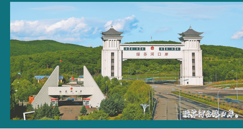
玛速玛汽车配件出口基地。

采用“主会场+分会场”办会模式，绥芬河首次以双会场机制深度融入哈洽会，全面践行省委“双买双卖”工作要求，集中展现口岸城市发展底蕴与实干成效。透过哈洽会这扇窗口，一个加速从“过境通道”向“综合枢纽”跃升的绥芬河，正以产业创新为突破口，奋力争当构筑我国向北开放新高地排头兵。