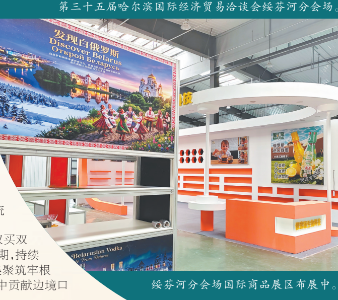
绥芬河分会场国际商品展区布展中。

潮涌龙江风正劲，开放枢纽启新程。本届哈洽会，绥芬河全面展示了深耕“双买双卖”，推进向北开放的丰硕成果。站在新的历史起点，绥芬河将牢牢把握关键机遇，持续放大区位优势，以通道畅联夯实基础，以经贸提质激活动能，以产业集聚筑牢根基，以平台赋能释放潜力，全力打造向北开放新高地，在龙江全面振兴全方位振兴中贡献边境口岸城市的力量。