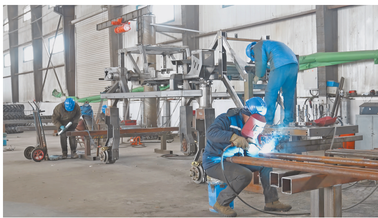
丰诺植保机械制造有限公司生产车间。