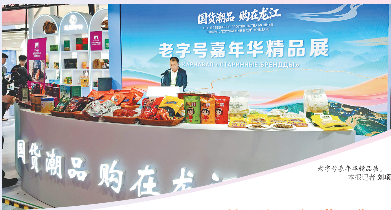
老字号嘉年华精品展。