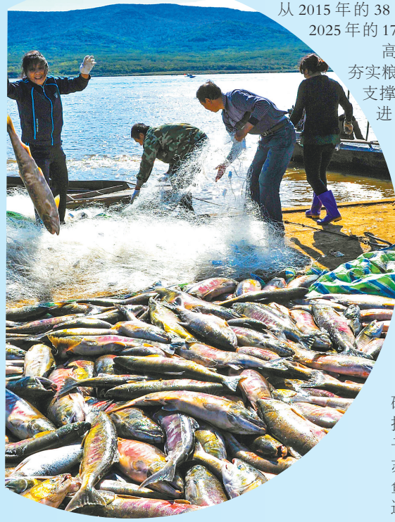
抚远渔民喜获丰收。

规模化经营激活农业发展新动能。以黑瞎子岛镇东安村玖成水稻种植专业合作社为龙头，全面推广“合作社+农户+企业”模式，引导分散土地“聚沙成塔”，推动农业生产由“小散乱”向“大精专”转变。玖成水稻种植专业合作社从成立之初的种植规模5400亩发展到超10万亩，带动170余户、450名社员增收致富。2025年，合作社粮食总产量突破2.5万吨，较2016年增长24倍；水稻亩产达1306斤，较2016年增长63.25%。社员人均收入升至7.8万元，较2016年增长290%。全市土地流转面积突破420万亩，农业规模化经营率达85%以上，培育国家级示范社1家、省级示范社3家，新型农业经营主体从2015年的38户增加到2025年的176户。