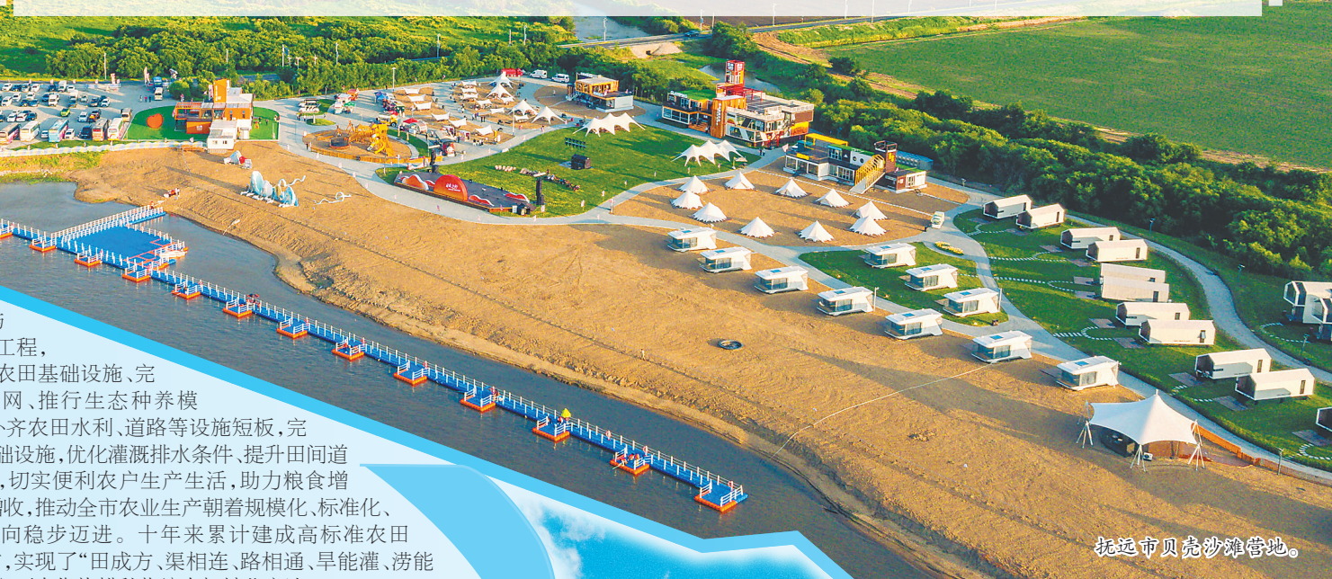
抚远市贝壳沙滩营地。