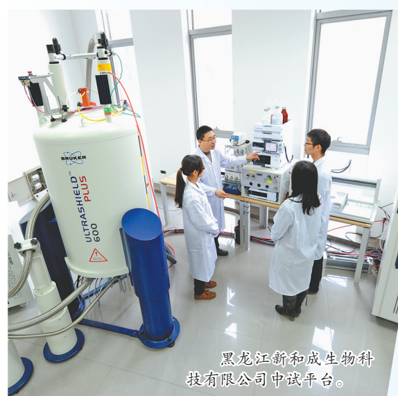
黑龙江新和成生物科技股份有限公司中试平台。