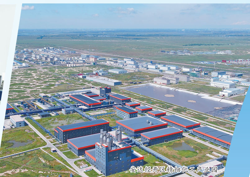
安达经开区精细化工产业园。