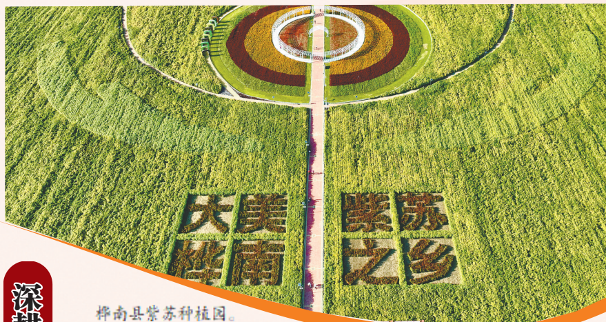
桦南县紫苏种植园。

特色产业是县域经济的独特优势,是差异化竞争的核心密码。桦南县立足“中国紫苏之乡”资源禀赋,深耕特色产业,做强特色品牌,推动农文旅深度融合,让红色底蕴、绿色生态、紫色特色转化为发展优势,以“周末桦南”特色IP为牵引,走出革命老区、农业大县、生态之城协同振兴的特色路径。