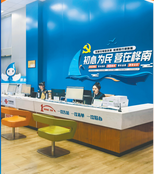
高效办成一件事窗口。

2026年,当第一缕春风拂过三江平原,黑土地深处已然涌动着澎湃的发展热潮。走进桦南,项目建设现场塔吊林立、机器轰鸣,工业园区里生产线高速运转、订单饱满,政务服务大厅内流程高效、笑脸相迎,紫苏产业园中产品琳琅满目、香气四溢……一幅县域经济高质量发展的生动画卷,正在这片充满希望的土地上徐徐铺展。