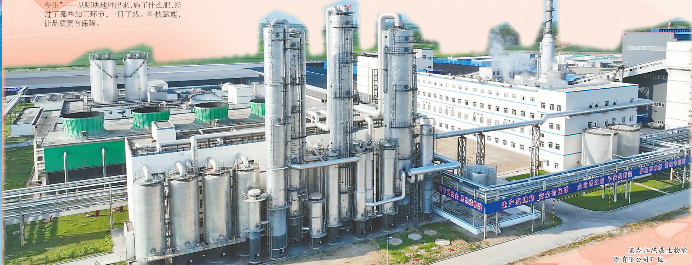
黑龙江鸿展生物能源有限公司厂区。