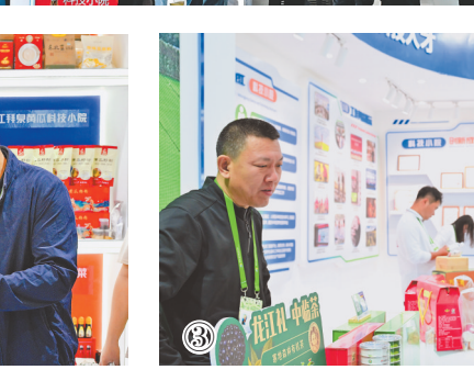
图①：中国农技协·黑龙江科技小院展区。 图②：科技小院农产品受欢迎。 图③：科技小院成果展示。