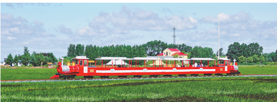
稻田公园观光小火车。