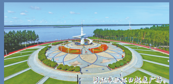
同江市三江口景区广场。

好风景更需要好服务。依托中俄免签及离境退税政策叠加效应，同江赴俄罗斯哈巴罗夫斯克、比罗比詹开展跨境推介，对接当地旅行社10家，形成“两日游—多日游”梯度产品体系。一站式外国人服务中心成立，“三位一体”护游体系建立健全，“引客入同”奖励办法出台，游客满意度超98%。 智慧旅游平台加快建设，中俄双语服务、母婴室、医疗急救点等便民设施不断完善，江景异域民宿集群别具风情，非遗数字体验馆免费延时开放、中医康养等特色服务温暖人心。每一位来到同江的游客，都能游得舒心、住得安心、购得放心。 “中俄界·赫哲乡·旅居到同江”的品牌越擦越亮。界江潮涌，风正帆悬。同江正以独特的界江风光、浓郁的民族风情、优质的跨境体验，吸引着越来越多的中外游客走进同江、爱上同江，为边境地区高质量发展注入源源不断的文旅动能。