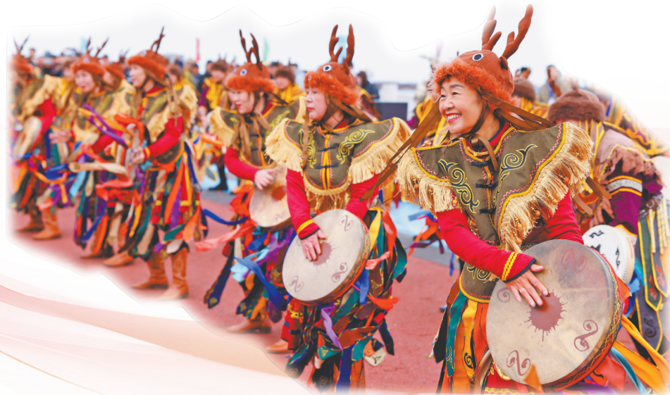
开江文化周——祈福祭祀

同江市是集铁路、水运、公路于一体的对俄口岸城市，也是全国赫哲族人口最集中的聚居地。当前，同江市立足向北开放前沿区位，以中俄博览会和哈洽会重要窗口、主阵地与加速器，推动通道优势向产业优势、发展优势转化。在中俄经贸合作、非遗文旅融合、特色产业升级、新质生产力培育等领域，同江正持续突破，以一域之光为全省高质量发展增光添彩。