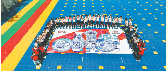
小朋友的瓷器拼图。

此次活动将文物知识、传统美学与幼儿教育相融，让孩童近距离感受青花瓷独特魅力，同时培养观察力、创造力与协作能力。汤原县博物馆将深挖馆藏资源，推出多元化社教活动，搭建文化传承美育平台，推动传统文化在少年儿童心中扎根生长。