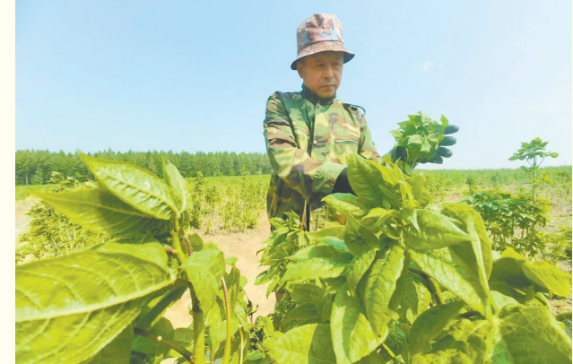
查看刺五加生长情况。