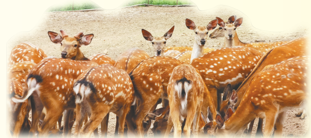
宝山山庄参鹿基地。

如今，寒地龙药等区域品牌影响力持续扩大，汤原林下产品正凭借独特的寒地特色与优秀品质，在激烈市场竞争中站稳脚跟，让生态价值真正转化为品牌价值和经济效益。