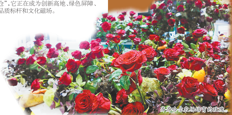
齐齐哈尔农场培育的玫瑰。

“四个农业”将大国粮仓的“压舱石”夯实，而“农文旅商”齐头并进则把黑土地的故事讲得愈发生动饱满。在这片孕育过无数奇迹的辽阔大地上，精彩，正在发生。