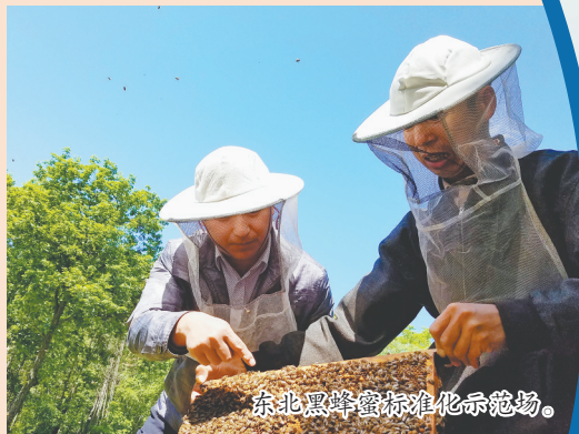
东北黑蜂标准化示范场。