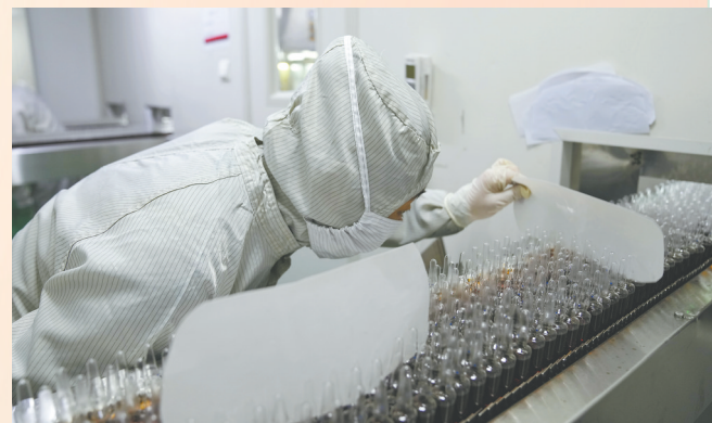
刺五加制剂产品质量检。