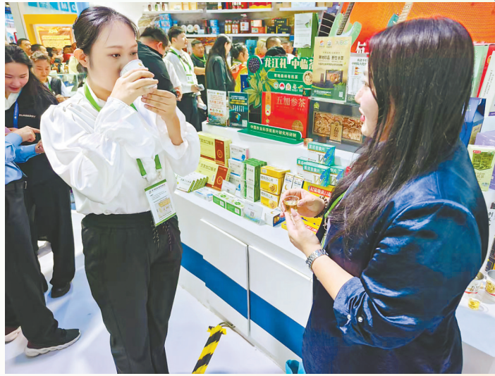
客商在展会上品鉴刺五加茶。