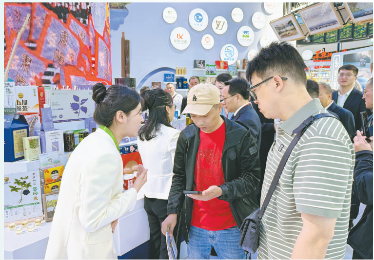
乌苏里江药业工作人员向客商介绍刺五加系列产品。

依托得天独厚的林下资源,虎林深耕刺五加全产业链,以黑龙江乌苏里江制药有限公司、黑龙江佑康食品有限公司、黑龙江省新曙光刺五加生物科技开发有限公司为代表的刺五加相关企业,在药品、茶饮、保健品领域精耕细作,用一件件产品、一项项技术,勾勒出虎林刺五加产业从深山资源迈向现代化产业的成长轨迹。