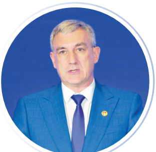
俄罗斯阿穆尔州州长瓦西里·奥尔洛夫