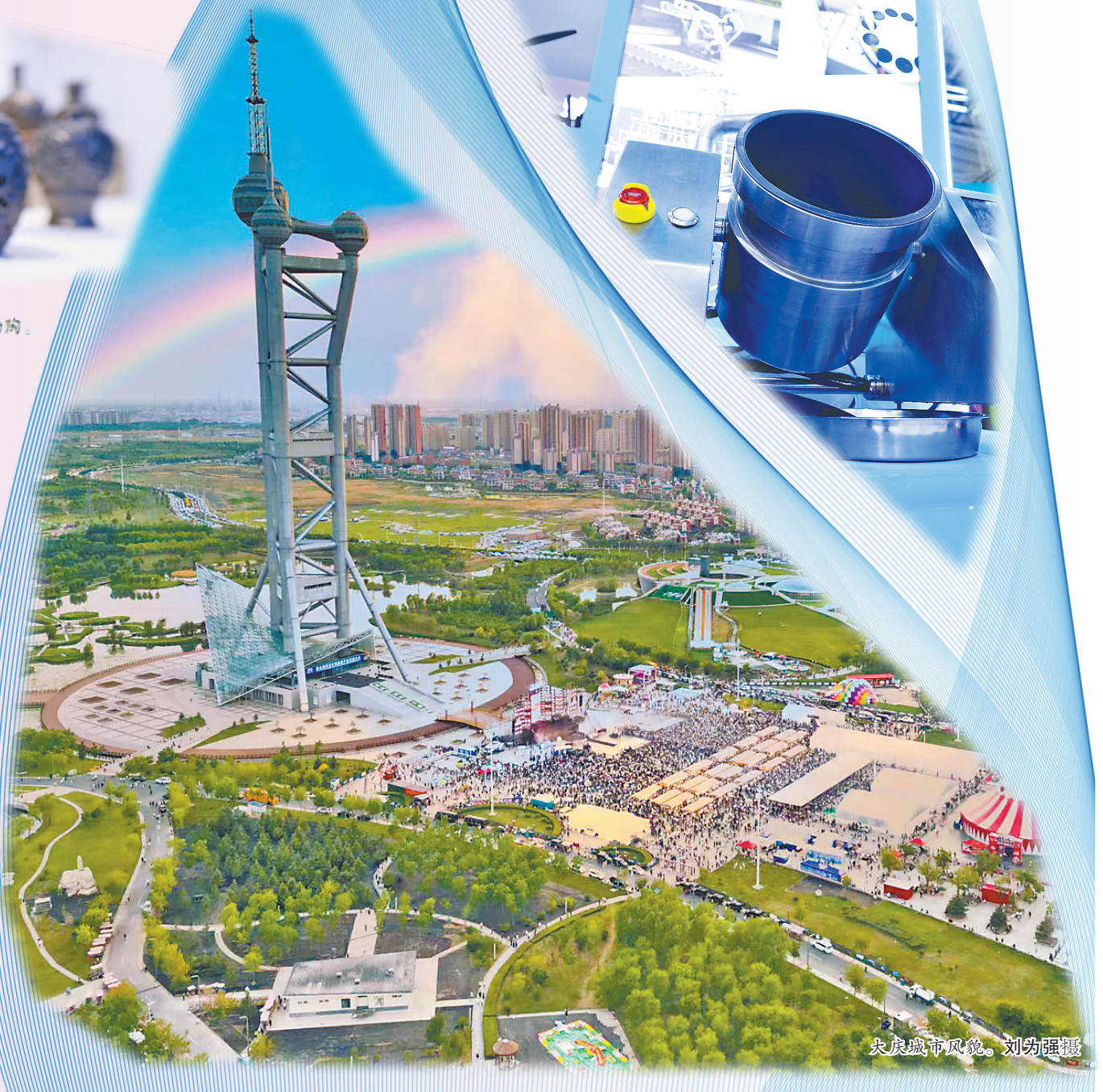
大庆城市风貌。