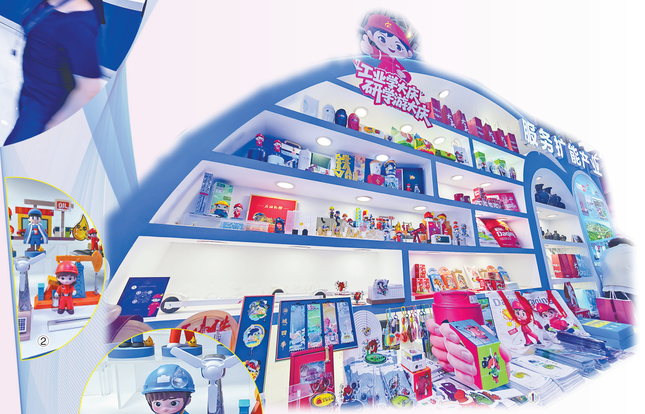
①②③④丰富多彩的文创产品。

集成多项核心技术的小型炒菜机器人、超高电子迁移率半绝缘砷化镓衬底芯片材料、科技感十足的沃尔沃S90新能源汽车……作为第十届中国博览会、第三十五届哈洽会的重要参展城市之一，大庆市聚焦数字经济与未来产业，尽显新技术、新材料、新创意、新模式，大批高端、智能、绿色新产品颇受青睐，展现出新质生产力发展的强劲动能，让人们看到“油城”大庆产业转型、科技创新、开放合作与文旅融合的崭新形象。