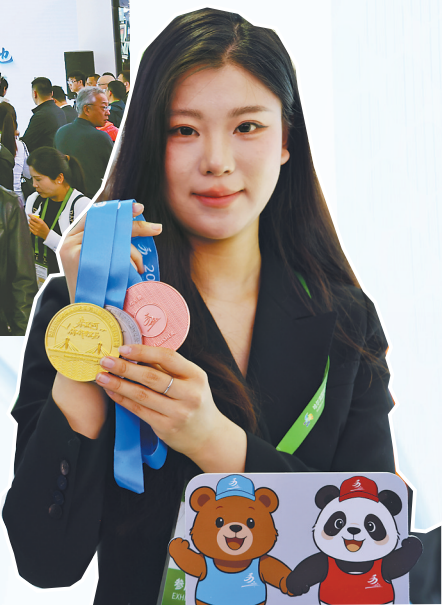
工作人员在宣传跨境马拉松赛事。

有机食品，凭借优良品质获得客商广泛关注，充分展示了北安市发展科技农业、绿色农业、质量农业、品牌农业的深刻实践与显著成效。北安市将以玉米全产业链、大豆产品、特色乳制品和天然苏打水四大加工产业集群，聚势赋能、协同发力，不断夯实产业根基、延伸价值链条，为县域经济提质增效、转型升级注入源源不断的内生动力。