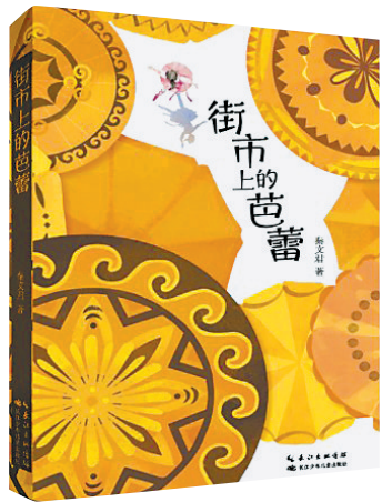
《街市上的芭蕾》/秦文君/长江少年儿童出版社/2024年12月

作家秦文君的长篇小说《街市上的芭蕾》以那渡坝彝族少女小云儿苦练芭蕾舞的经历为主线，深情地讲述了新时代少年追求舞蹈梦路上的欢喜与迷茫，展现了小镇居民勤劳朴实的底色，为读者带来生动感人的温情画卷。