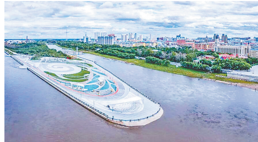
黑河市爱辉区大黑河岛。

本报讯(记者周静)日前,记者从省农业农村厅获悉,2026年黑龙江省“村BA”篮球联赛总决赛将在黑河市爱辉区拉开帷幕。