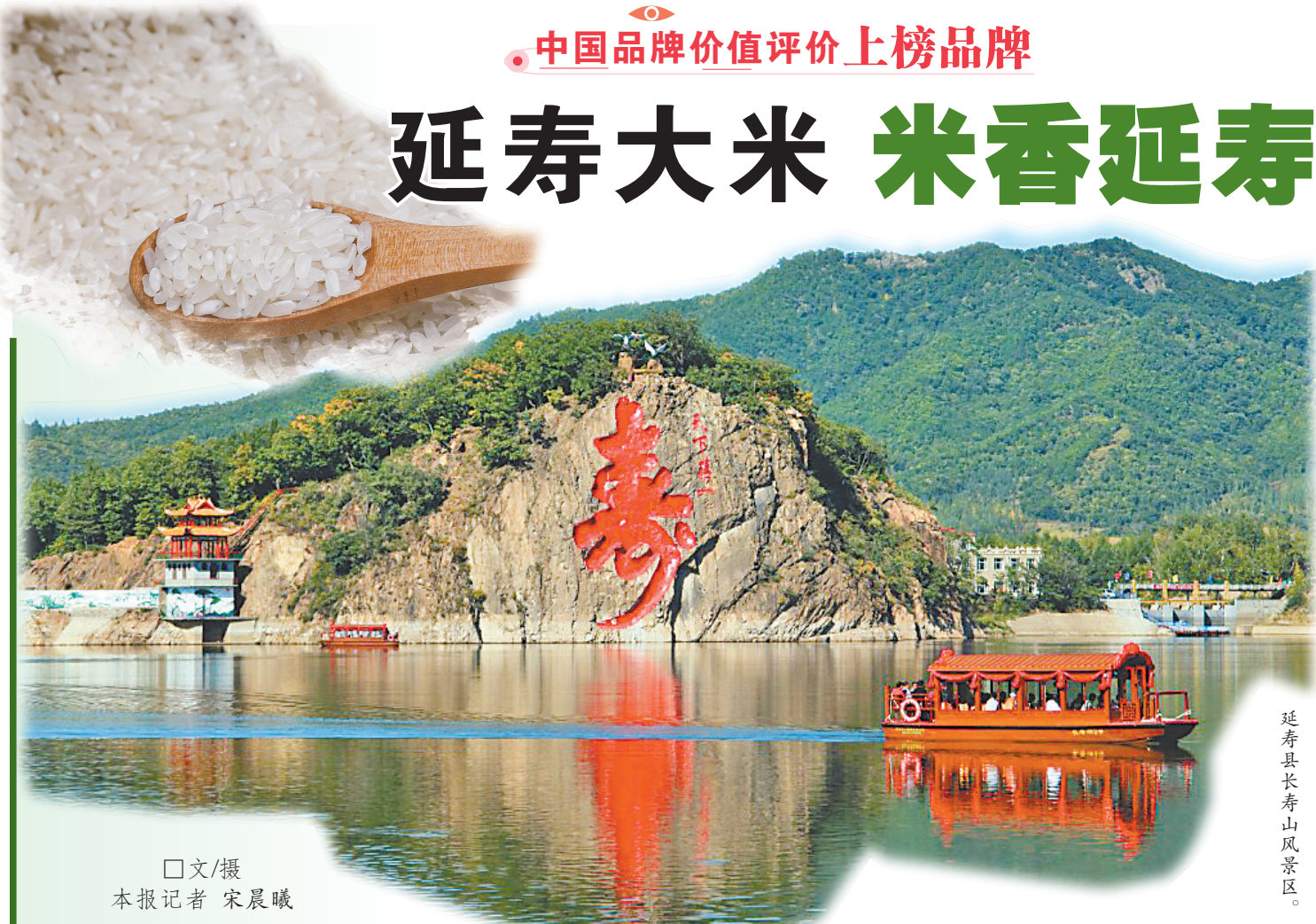
延寿县长寿山景区。