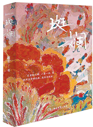
《斑斓》/塞壬/湖南文艺出版社/2025年12月

让她关注到自我之外的生命。花草草在她笔下是诗的意象,是寄托了情感且不可辜负的生命。太阳花匍匐在地,向四面八方伸展,开成斑斓的花布。“浇水,捉虫,俯下身去跟它们说话”,看见“花蕊含着朝露,盈盈点头”,花草生长、鸟儿鸣叫的晨曦,唤醒她积极的生命状态。