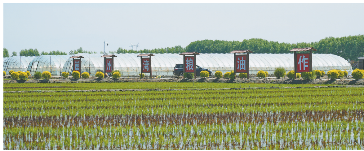
崖州湾粮油作物创新平台试验基地。