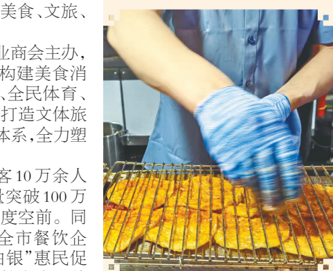
肇东小饼。