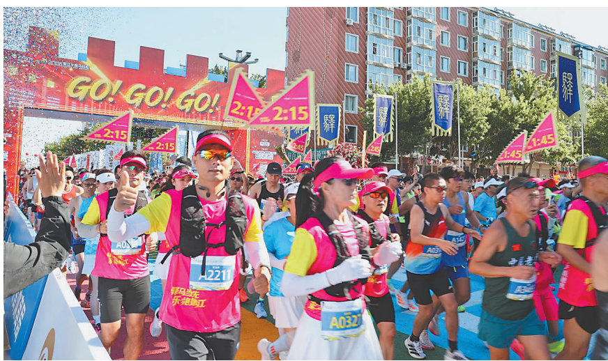
2026嫩江半程马拉松现场。

赛事全程创新场景、升级体验,以沉浸式、多元化的特色设计,打造兼具古韵新风与地域特色的文体盛会。启动仪式上,百名将士戎装击鼓,雄浑鼓声复刻黑土地古驿边强军、骏马驰行的百年图景,唤醒城市独特的驿路记忆。赛场上,传统文人与现代科技深度融合,身着将军服的智能机器人“小鼻嘎”全程互动助威,以新潮科技点亮赛场活力。千人齐唱,万众同心,尽显嫩江包容友善、团结奋进的城市品格;本地铁骑营戎装骏马踏道前行,与现代跑者并肩驰骋,成为赛事标