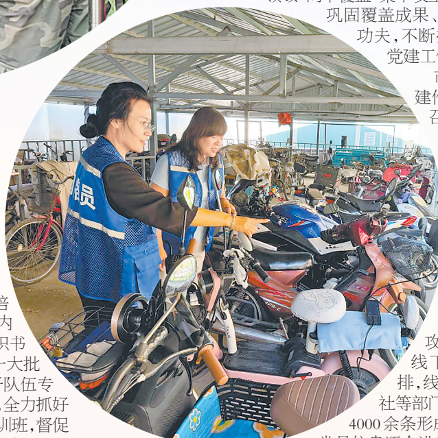
社区工作者下沉网格排查安全隐患。