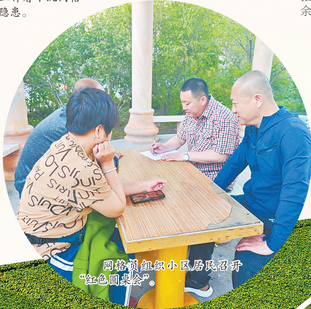
网格员组织小区居民召开“红色圆桌会”。