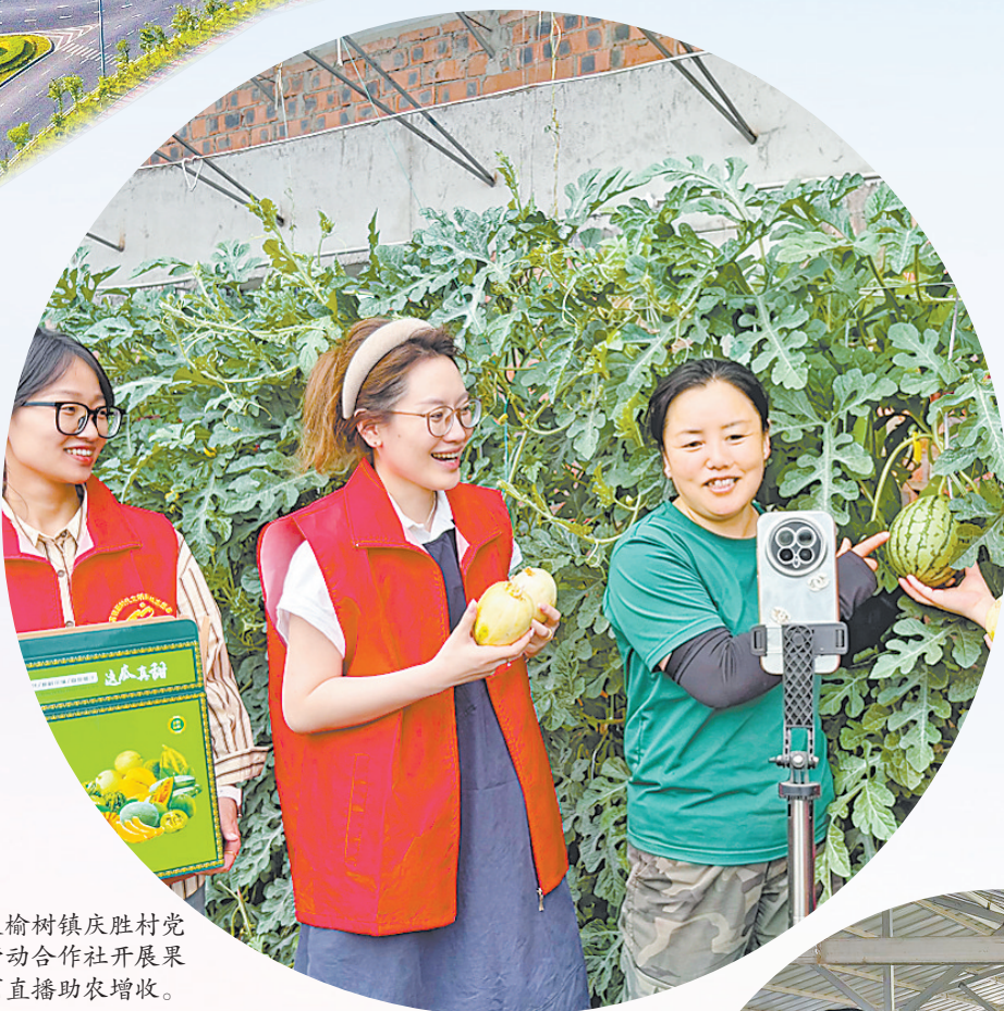
大榆树镇庆胜利党支部带动合作社开展果蔬电商直播助农增收。

坚持大抓基层的鲜明导向,积极打造大屯村“党建兴家”、邵店村“四强四美”等基层党建品牌40余个,为构建“以点串线、以线带面”的全域党建格局提供示范样板。结合村“两委”换届“回头看”工作,精准确定16个软弱涣散村党组织,建立市镇两级领导包联机制,择优选派驻村第一书记,严格落实“四个一”整顿措施,为整顿工作打牢基础。同时,结合“县乡共管·夺旗争星”活动成果,组织庆祝村、仁和村等17个先进村与软弱涣散村、后进村结成共建对子,“一对一”制定结对帮带计划,进一步提升基层党组织凝聚力、战斗力,推动基层党建提质增效。