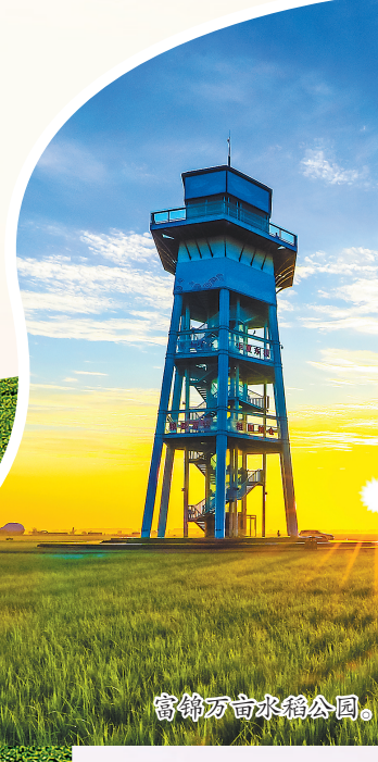
富锦万亩水稻公园。