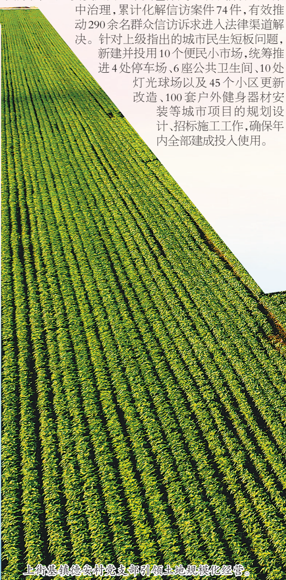
上街镇镇委会村党支部引领土地规模化经营。