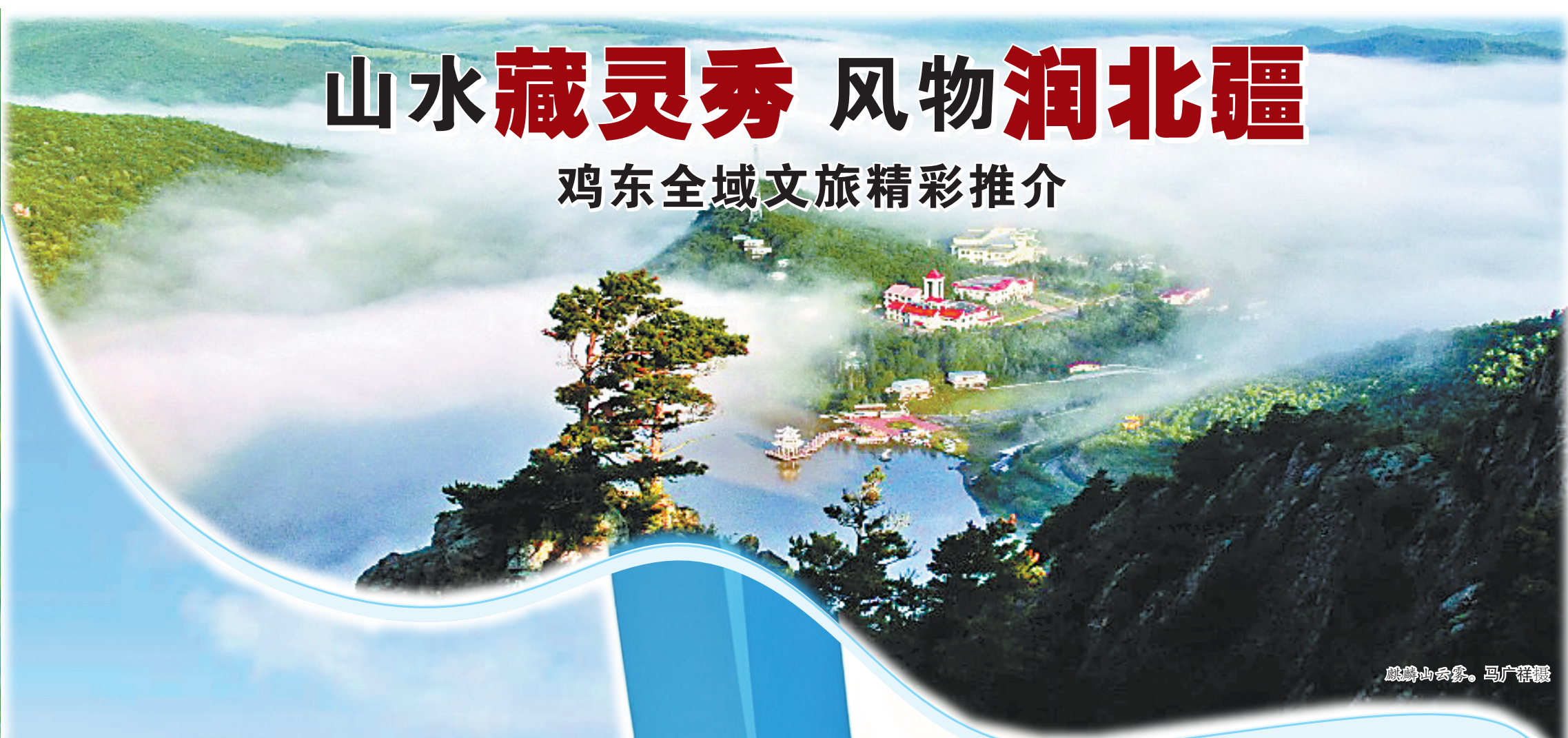
麒麟山云雾。