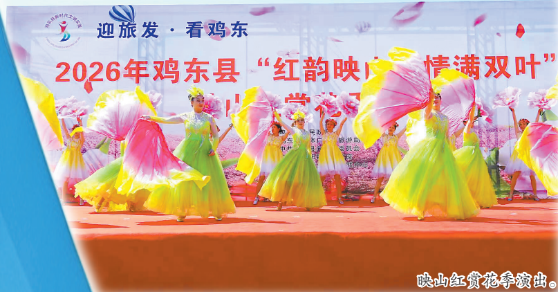
映山红莲花争演出。