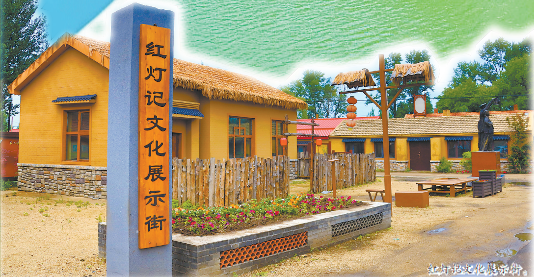
红灯记文化展示街。