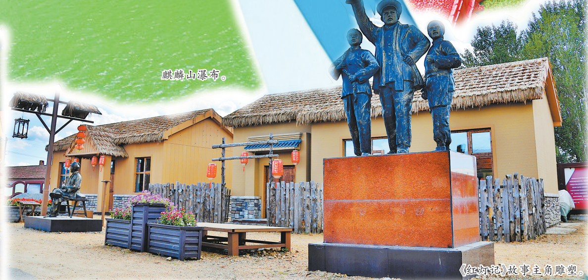
《红灯记》故事主角雕塑。