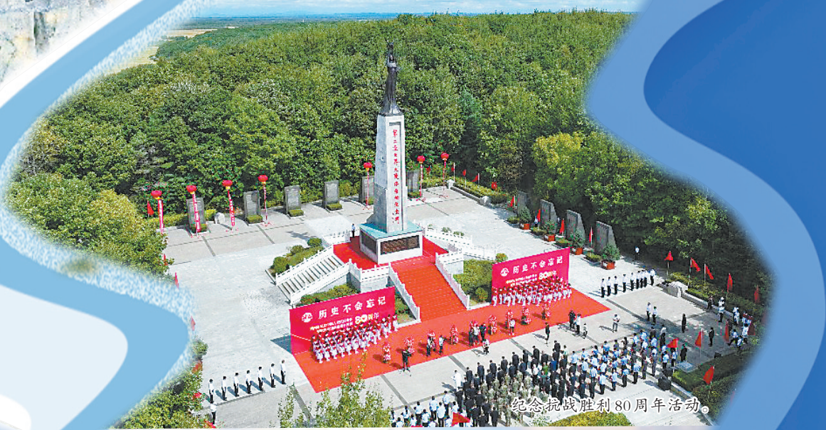
纪念抗战胜利80周年活动。