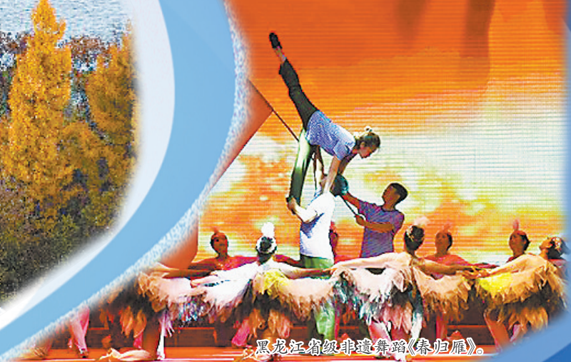
黑龙江省非遗舞蹈《春归雁》。