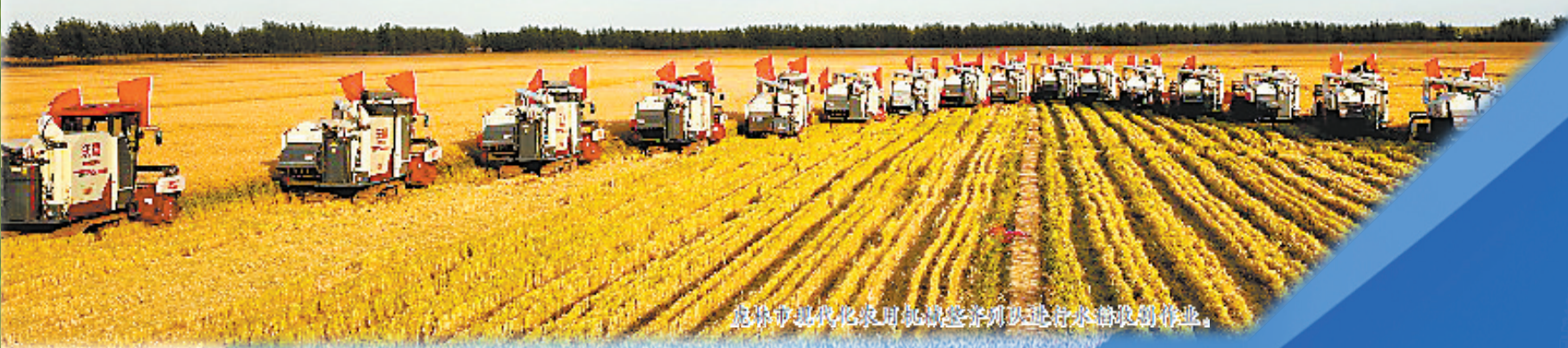
虎林市现代农业机械联合收割机正在田间作业。