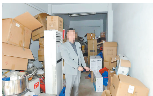
左图：该案犯罪嫌疑人现场指认保健品存放仓库。