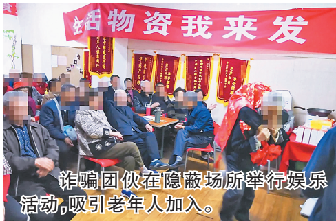
诈骗团伙在隐蔽场所举行娱乐活动，吸引老年人加入。