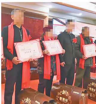
上图：诈骗团伙在讲座中给老年人“颁奖”加深他们的信任。