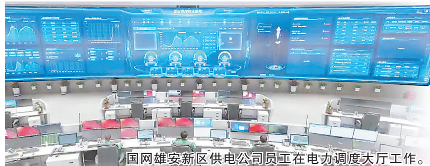
国网雄安新区供电公司员工在电力调度大厅工作。

截至目前，淀区野生鸟类达296种，较新区设立前增加90种，全球极危物种青头潜鸭在这里繁衍栖息。今年4月，雄安新区生态环境监控中心公布，白洋淀发现中国新记录种五月四节蜉，这种敏感型水生昆虫的出现，是白洋淀水生态系统持续向好的