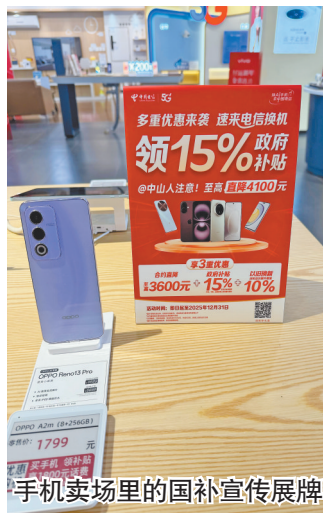
手机卖场里的国补宣传展牌

从现实来看,“国补”政策在以真金白银利好消费的同时,也面临很多挑战。补贴资金消耗过快是一方面,另一方面,为了打击套补等违规行为,部分地区需要对补贴系统进行升级。例如浙江、江苏等地紧急新增了IP监测、设备码绑定等功能,这在规范市场的同时,一定程度上会影响补贴的发放速度。江苏省商务厅相关负责人也称,目前江苏的平台正