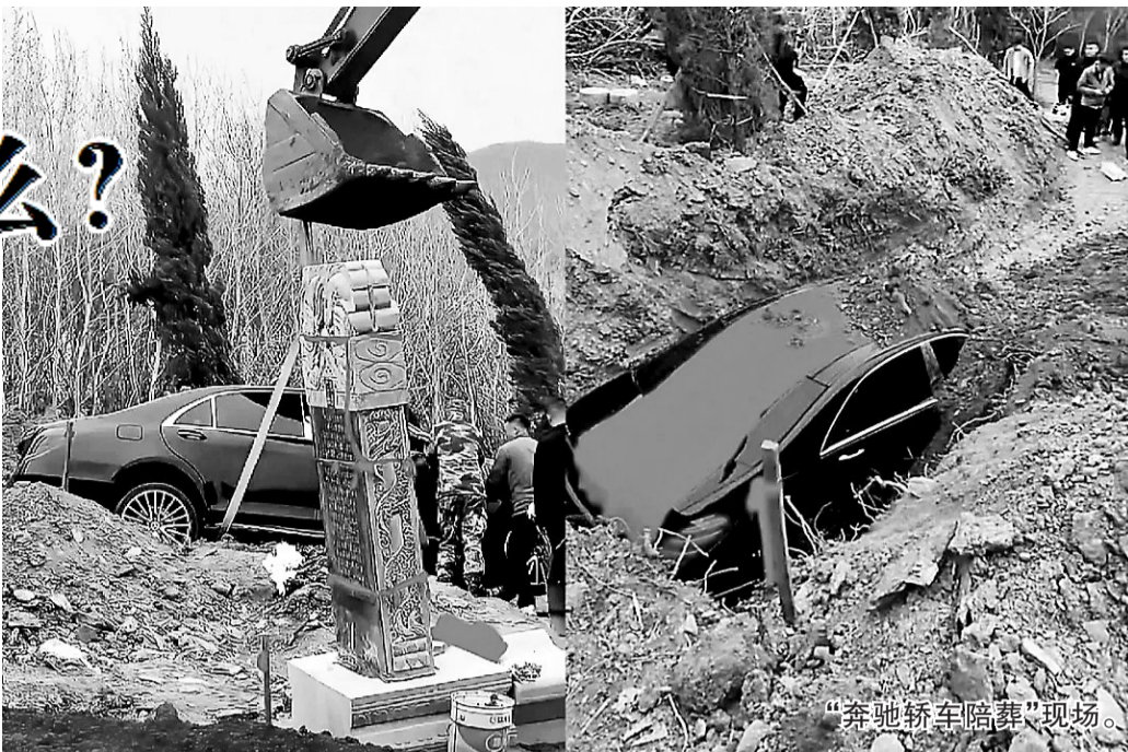
“奔驰轿车陪葬”现场。