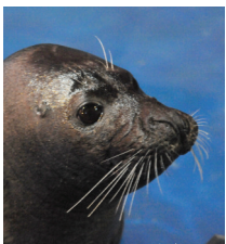
看它那样子,不是很“呆萌”?

那么,这些海豹是如何接受训练的,它们身上又有着怎样的“萌事”呢?就随记者一起去哈尔滨极地馆“先睹为快”吧!