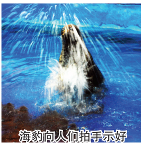
海豹向人们拍手示好

5个小家伙的性格也各有千秋。莎莎是雌海豹中的“淑女”,胆子小,连吃饭都常常躲在后边。里奥聪明伶俐,学什么动作都很快,因此,从驯养师那里获得了不少口福;为了让驯养师陪他玩,他还学会了抱大腿,这时总能获得驯养师的爱抚。亨利有自己的小想法,他那“男高音”最初就是自创的,被驯养师捕捉到后,练成了“独门绝技”。最有个性的是“酸脸猴子”阿宝,技术活虽然没有啥,但是能挤,每次看到驯养师拿着鱼,他才不管什么“长幼有序”、“女士优先”,干脆跳到饲养员手边抢食物。因为牙齿尖,连朝夕相处的驯养师在投食和训练时,都要防着被它的牙齿“误伤”。